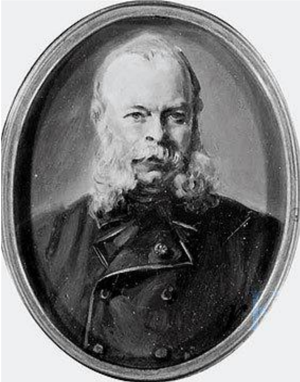
Jhr. mr. Carel Jan Chr. H. van Nispen tot Sevenaer 1824-1884. lid van de Tweede Kamer 1871-1884