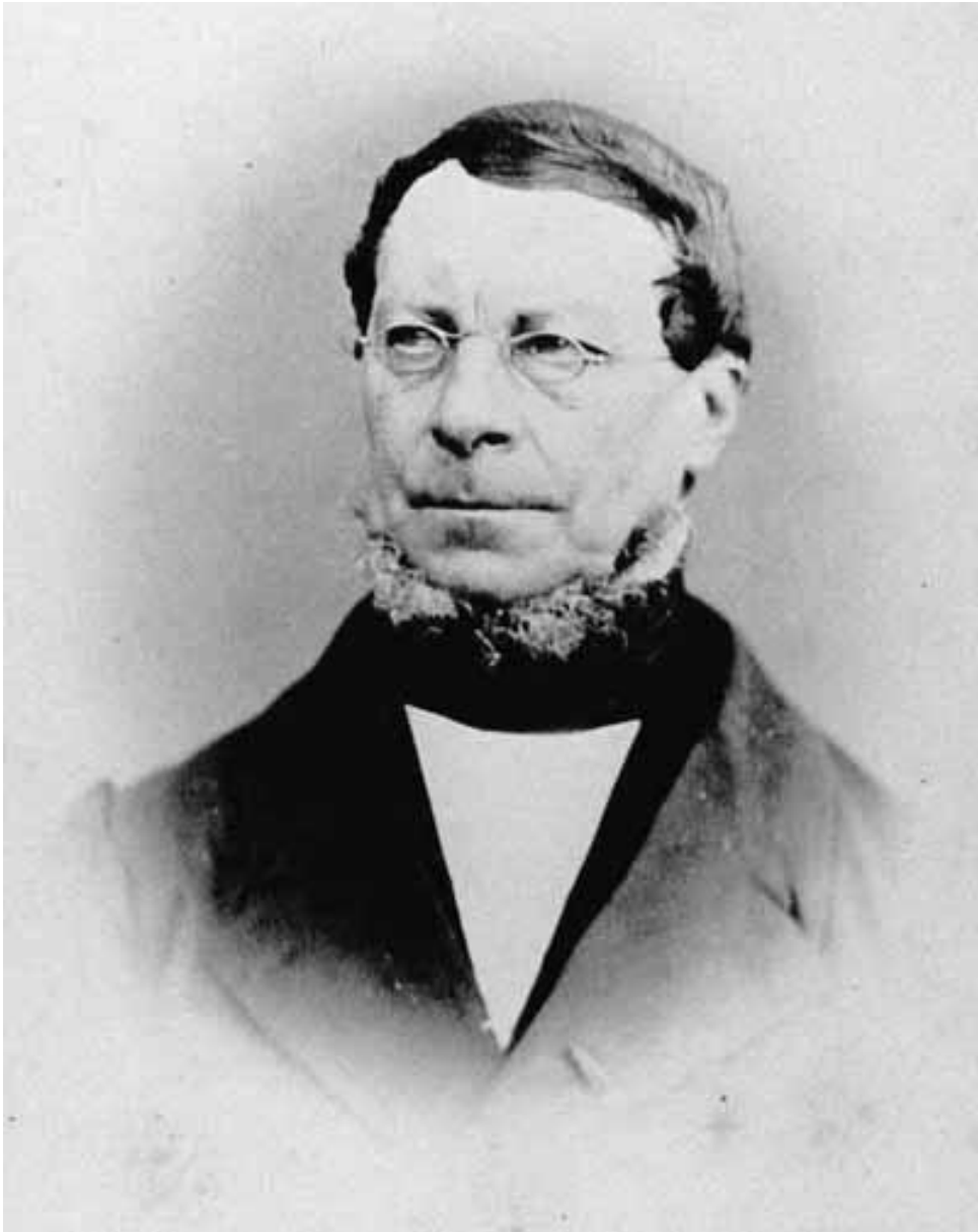
Jhr. Jan A.Ch. van Nispen van Sevenaer 1803-1875, lid van de Tweede Kamer 1848-1875