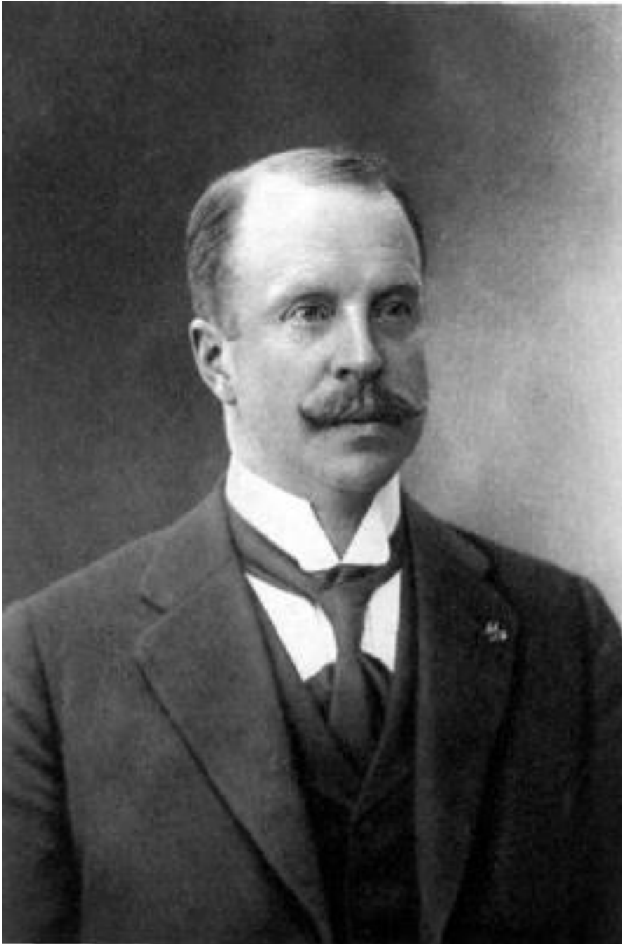
Jhr mr Octave F.A.M. van Nispen tot Sevenaer 1875-1956. lid van de Tweede Kamer 1901-1915 voorzitter van die Kamer 1912-1913